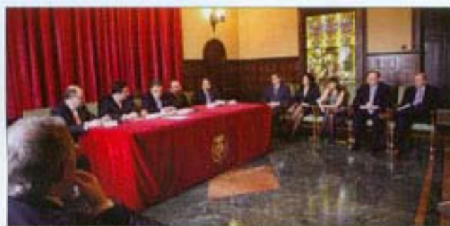
Momento de la firma del acuerdo.

Con el objetivo de difundir y fomentar en la sociedad leidana y en su tejido empresarial la innovación y utilización de las tecnologías de la información, IFR Group y Microsoft Ibérica, en colaboración con el Ayuntamiento y la Universidad de Lleida, han anunciado la creación y puesta en marcha del centro IFR Software Factory Microsoft Dynamics.